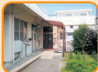
〈厨房裏〉 毎日このあたりには、 おいしそうな香りが…