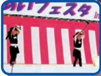
〈色見保育園のお遊戯〉 かわいい演技と衣装で華やかさを演出!