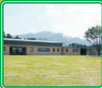
〈管理棟 (西側広場より)〉