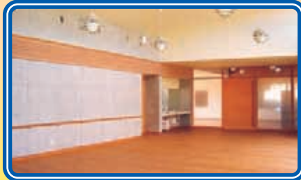
〈エントランスホール〉