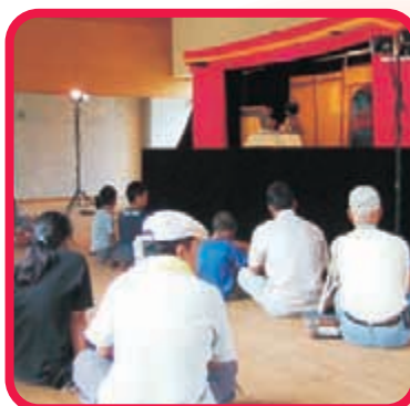
〈人形芝居 かすべる〉 今年は「ちびくろサンボ」