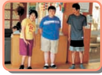
“ペタンク”の合間に