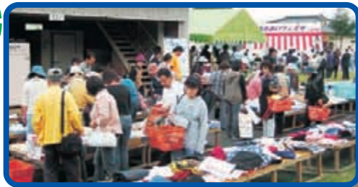
商品提供して下さったみなさん、ありがとうございました!