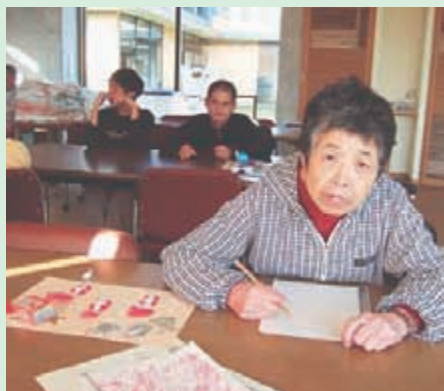
〈作業棟での創作活動〉

常に介護を必要とする人に、日中の介護及び創作的活動や生産活動の機会を提供します。