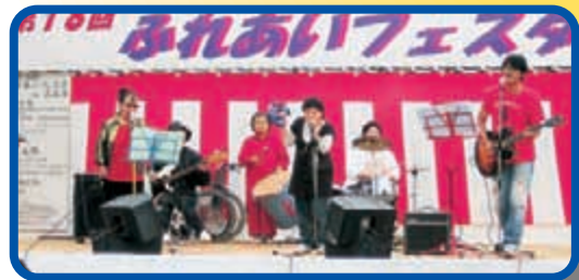
〈スクランブルズバンド演奏〉 会場も一緒になって盛り上がりました。