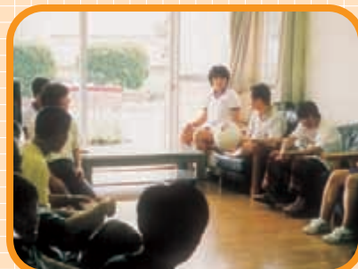
〈りんどう棟 ホール〉 みなさんのくつろぎの場でした。