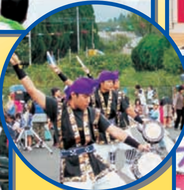
〈九州東海大 沖縄県人会の演舞〉 なかなか真似のできない動きです!