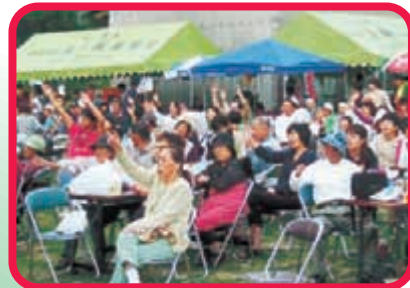
〈客席〉 一緒にうたってま〜す。