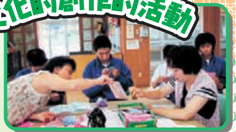
“季節の飾り作り” ワークキャンプの 中学生のみなさんと