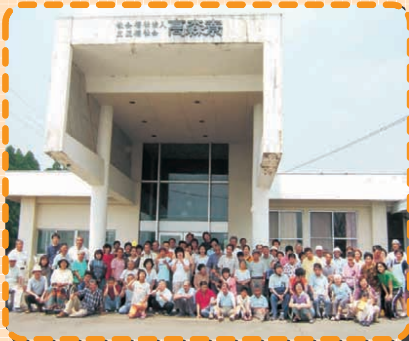
7月29日(日) 新棟への引っ越し完了。 生活道具の運び出された「高森寮」の前で記念撮影。 名残惜しさを感じました。