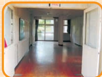
〈すずらん棟 ホール〉 みなさんの語らいの場でした。