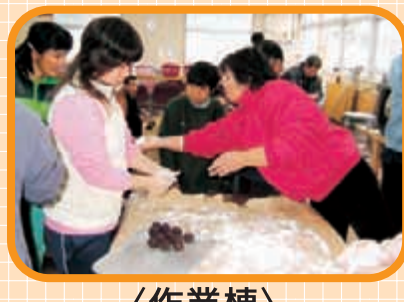
〈作業棟〉 洗濯物整理、軽スポーツ、行事…、 と様々な活躍をした場所。 (昨年の餅つきより)