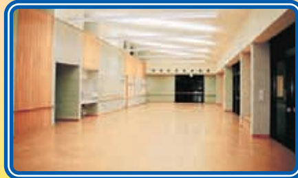
〈多目的室 (デイルーム)〉