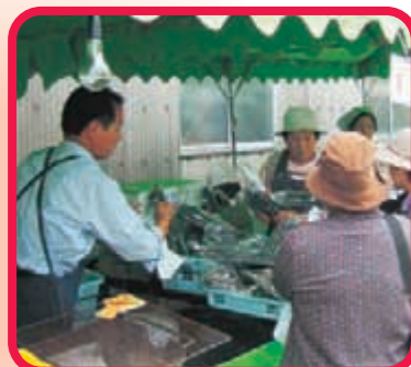
〈外部店舗〉 13店舗の参加がありました。