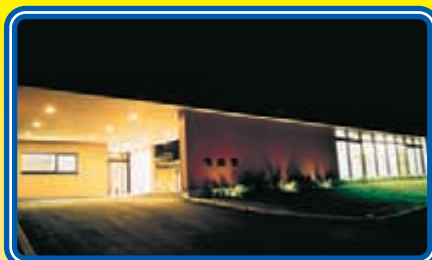
スポットライトをあびた車寄～玄関アプローチ～作業棟