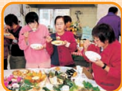
〈食堂〉 昨年の「成道会」。やはり、 ここが一番にぎやかなところ！