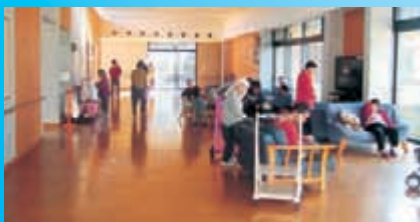
〈多目的室 (デイルーム)〉