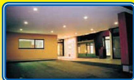
〈車寄～玄関アプローチ〉