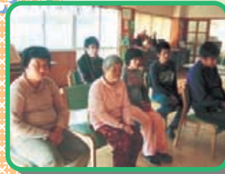
ピアノ演奏を 聴きながら…

支援センターは、一日20名の方にご利用いただけます。現在、25名の方が登録されています。これからも、数多くの方のご利用をお待ちしています。お気軽にご連絡下さい。 ☎〇九六七―六二一―〇三三七