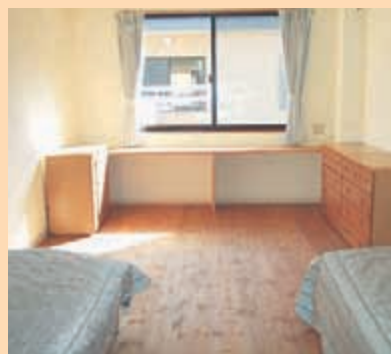
〈短期入所(ショートステイ)居室(二人部屋)〉

施設に入所していなくても高森寮の宿泊利用ができます。（障害福祉サービス受給者証が必要です。）