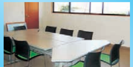
〈ミーティングルーム〉