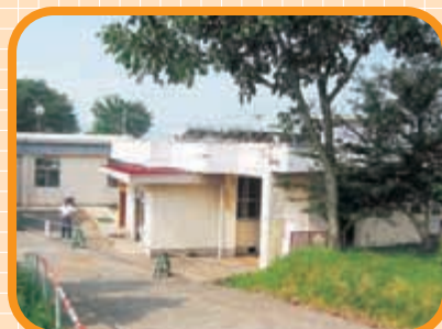
〈ケアホーム前から〉 この坂の上からの景色は 一変しました。