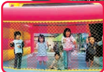
〈ふわふわトイソルジャー〉 カメラを向けたら集まってくれました。