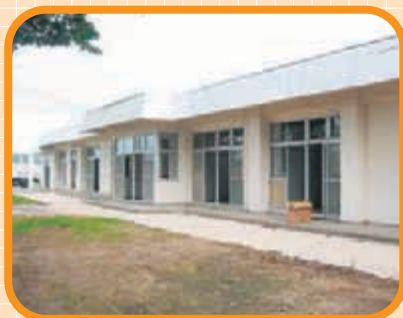
〈りんどう棟 前庭〉 天気の良い日は、憩いの場でした。