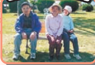
ただいま 施設内 散策中