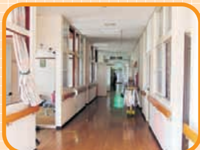
〈りんどう棟 廊下〉 この廊下を長〜く感じたものです。