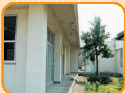
〈すずらん棟 中庭〉 ひっそりたたずんでいた マキの木は健在です！