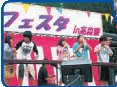
〈ラムネ早飲み大会〉 のどの乾きにもってこい!!