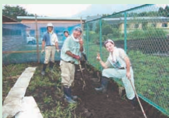
〈養鶏作業～養鶏場補修〉

就労を希望する人を対象に一定期間就労に必要な知識及び能力の向上のための支援をします。