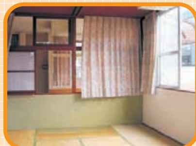
〈りんどう棟 1組〉 冬場過すなら、 この部屋が一番!!