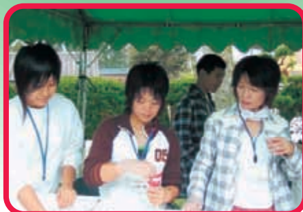
フライドポテト 〈バザーコーナー〉