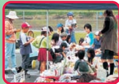
〈フリーマーケットコーナー〉