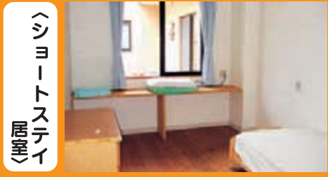
〈シヨットステイ 居室〉