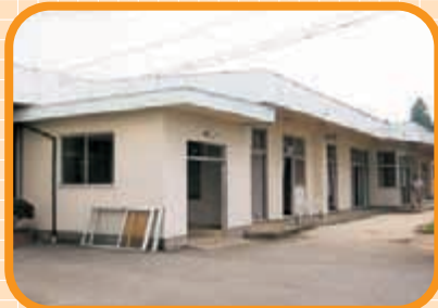
〈りんどう棟 玄関〉 棟内の荷物もだいぶ少なくなりました。