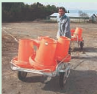
〈養鶏作業～給餌器運搬〉