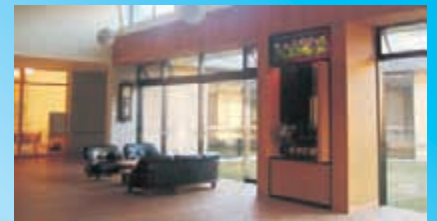
〈エントランスホール〉