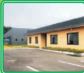
〈りんどう 男子棟(外観)〉