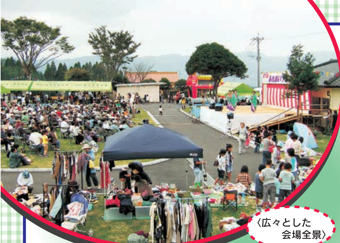
〈広々とした 会場全景〉