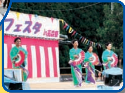
〈満丸会の舞〉 風の強さに扇子も舞を披露。