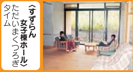
〈すずらん女子棟ホール〉 ただいまくつきぎ タイム