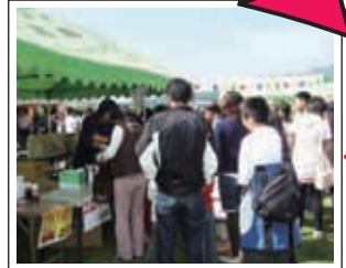
高森町商工青年部 によるバザー