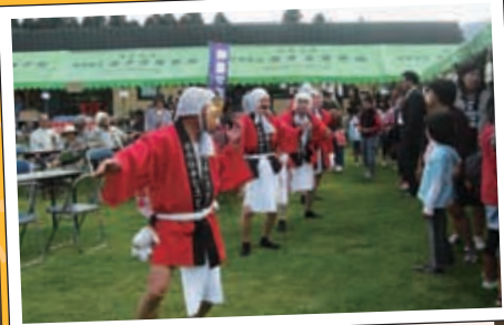
ひょっとこ踊り 会場内を面白おかしく踊っていただきました。