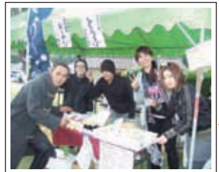
就労継続支援事業A型 豆富工房ゴ-スローさん