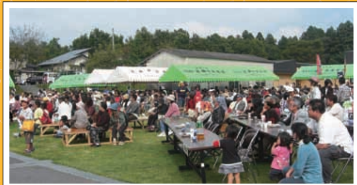
会場 例年になく多くの人に来ていただきました。