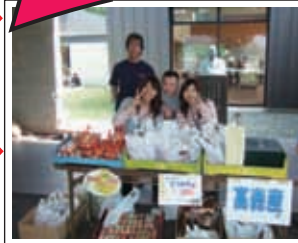
高森寮 有精卵販売