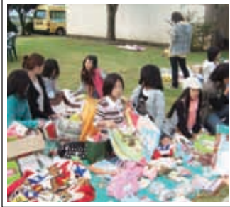
フリーマーケット