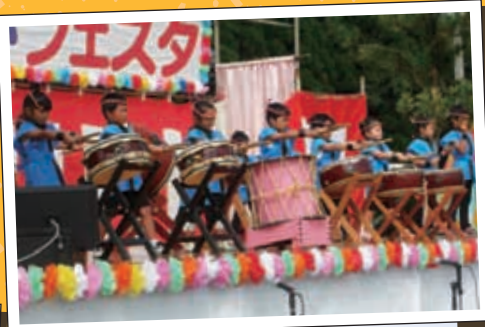
高森幼稚園 かっこいい太鼓の演奏でした。