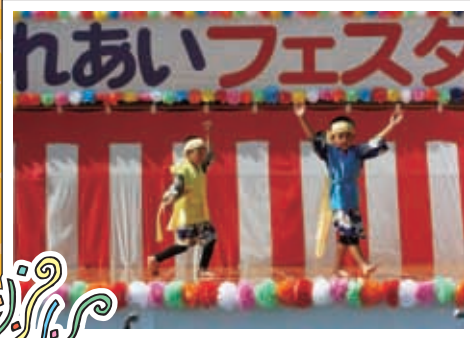
色見保育園 人数は少ないのですが、毎年出演していただいています。