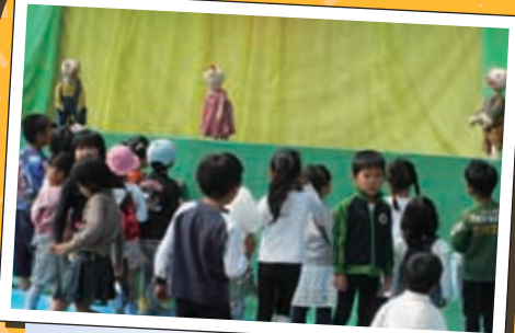
かあべる人形劇 今年初めて外での公演となりました。