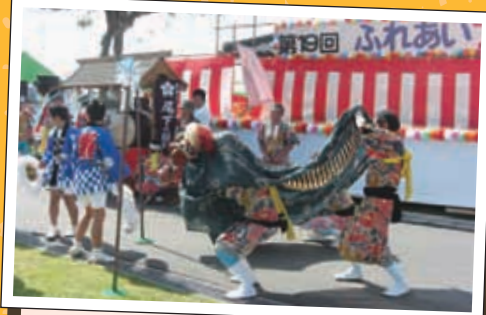
尾下獅子舞保存会 毎年、尾下管原神社に奉納されている獅子舞は熊本県の無形文化財にも指定されています。