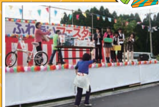
抽選会 特賞は熊本全日空ホテル ニュースカイペア宿泊券他 豪華賞品を用意しました。