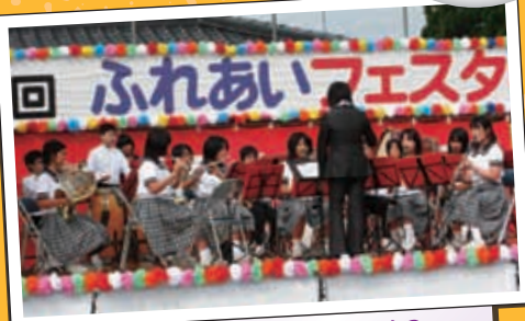
高森中吹奏楽部 今年のフェスタは吹奏楽部の演奏から始まりました。