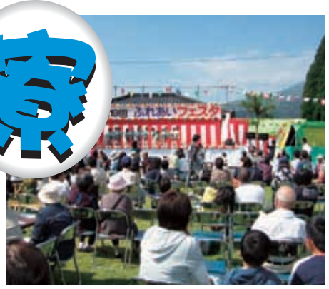
今年もたくさんのご来場ありがとうございました。そして、出店者のみなさま、ボランティアのみなさまお疲れ様でした。来年もみなさんに楽しんでもらえる企画を計画したいと思います。