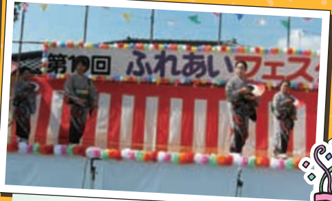
政輝(マサキ)社中 熟練した踊りでした。