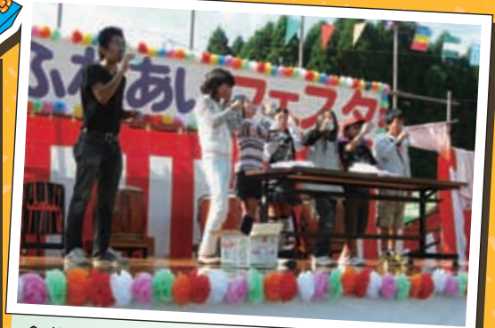
会場に遊びに来た子どもたちにはラムネ早飲み競争に参加してもらいました。中のビー玉に悪戦苦闘しつつも必死です。