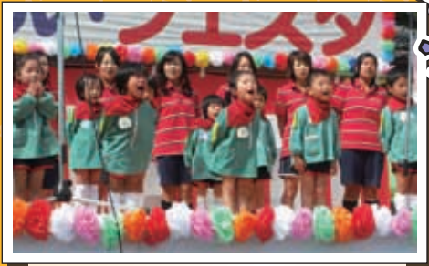
高森保育園 かわいい歌と踊りでした。