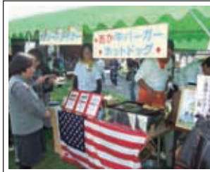
デノリーズ ダイナーさん