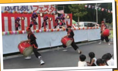
九州看護福祉大学 エイサー隊カリコシ 勇壮な踊りと鳴り響く太鼓の音はなんとも言いようがありません。