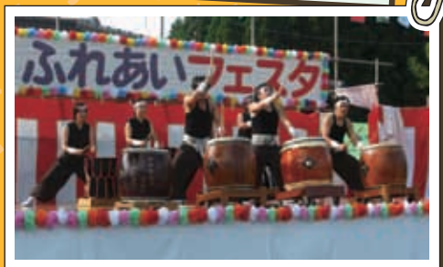
大名太鼓 福岡の天神 大名地区から来ていただきました。