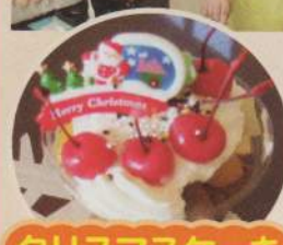
クリスマスケーキ