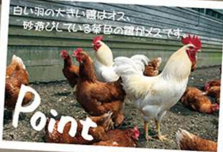
白い羽の大きい鶏はオス、 砂浴びしている茶色の鶏がメスです。

就B作業班では365日、鶏のお世話をしています。 鶏舎の中の鶏ふんを運び出し、新しいフカフカのおがくず を敷き詰めます。鶏ふんは専用小屋にて栄養豊富な堆肥 となり、作物の肥料として循環されます。