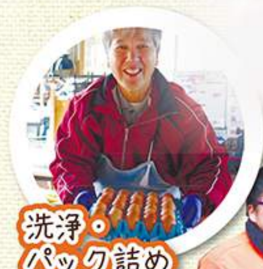
洗浄・パック詰め

鶏のエサとして、トウモロコシを自家栽培しており、新鮮で瑞々しい緑草を毎日与えています。