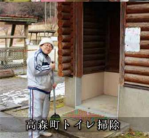
高森町トイレ掃除