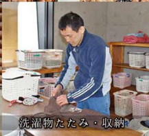
洗濯物たたみ・収納