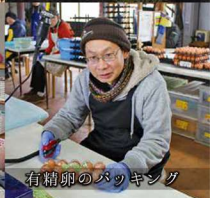
有精卵のパッキング