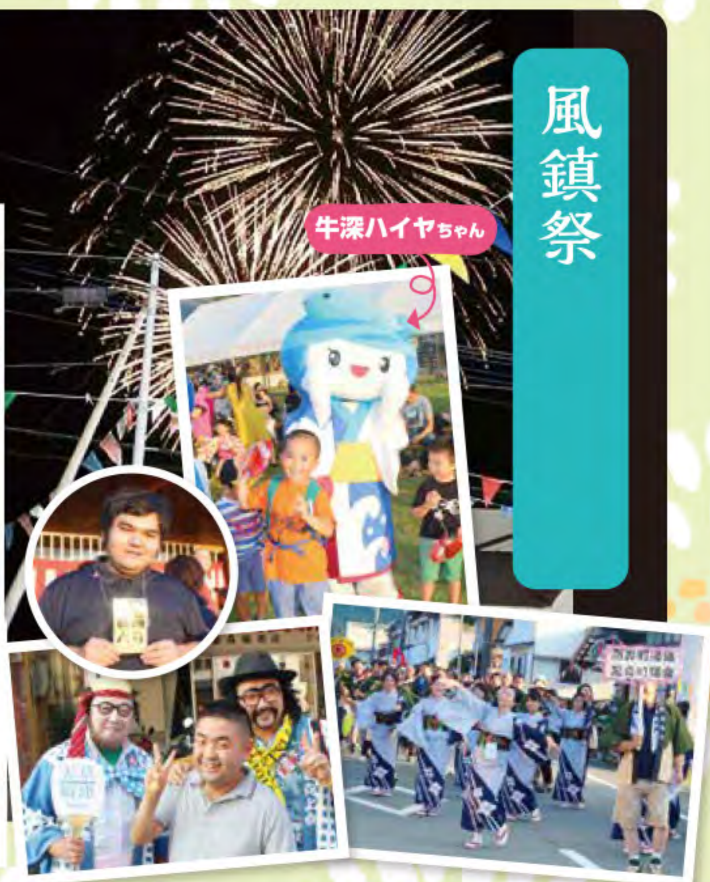
牛深ハイヤちゃん

高森寮自慢の職員たちです。今夜勤務の為残念ながら参加出来なかった職員も多数います。これからも利用者さんに寄り添い明るく元気にがんばって参ります。どうぞよろしくお願い致します。