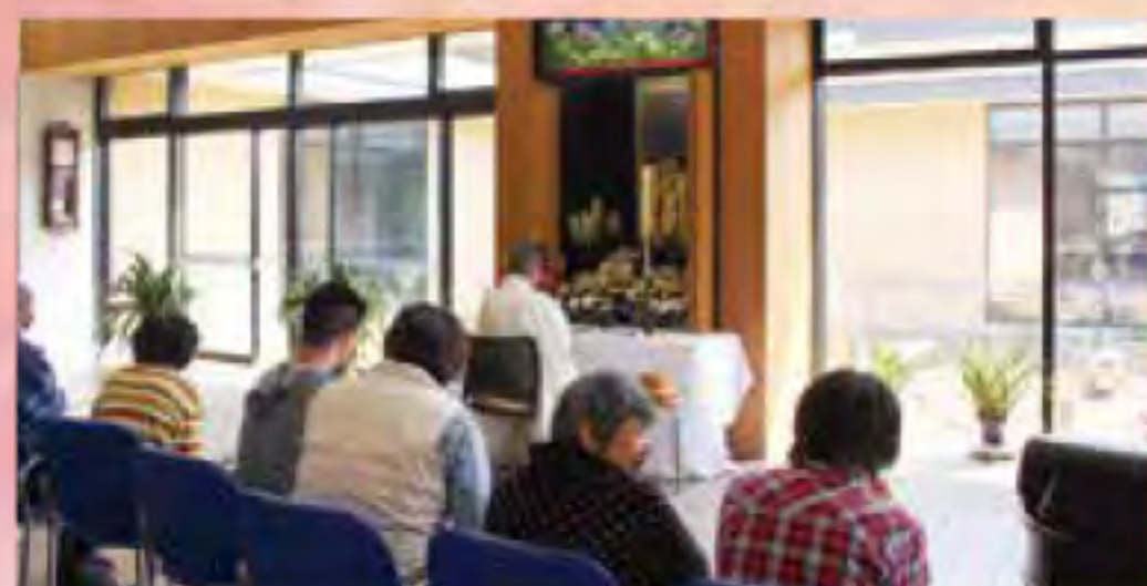
毎年4月に創設者の法要が行われます。

おひとりおひとりの生き方や考え方を尊重し、人々との関わりの中でその方らしい暮らしを大切にしています。