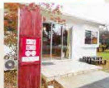
南阿蘇のパン屋さん 「PAIN DAIGO(パンダイゴ)」