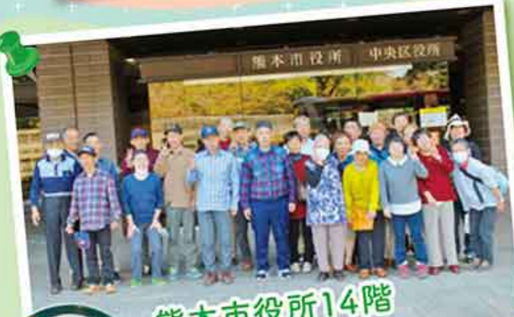
熊本市役所14階 ダイニングカフェ 彩さんにてランチ