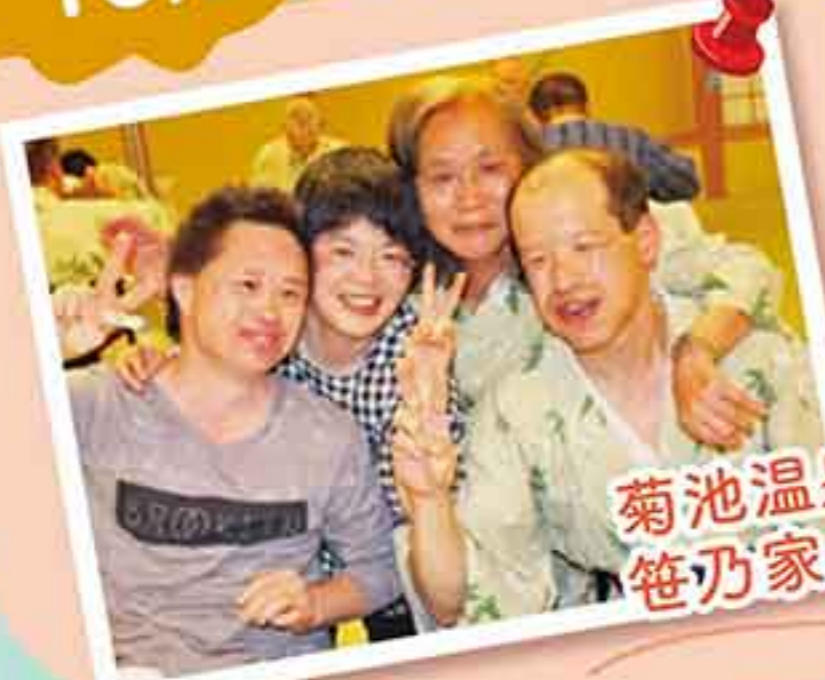
菊池温泉 笹乃家さんに宿泊