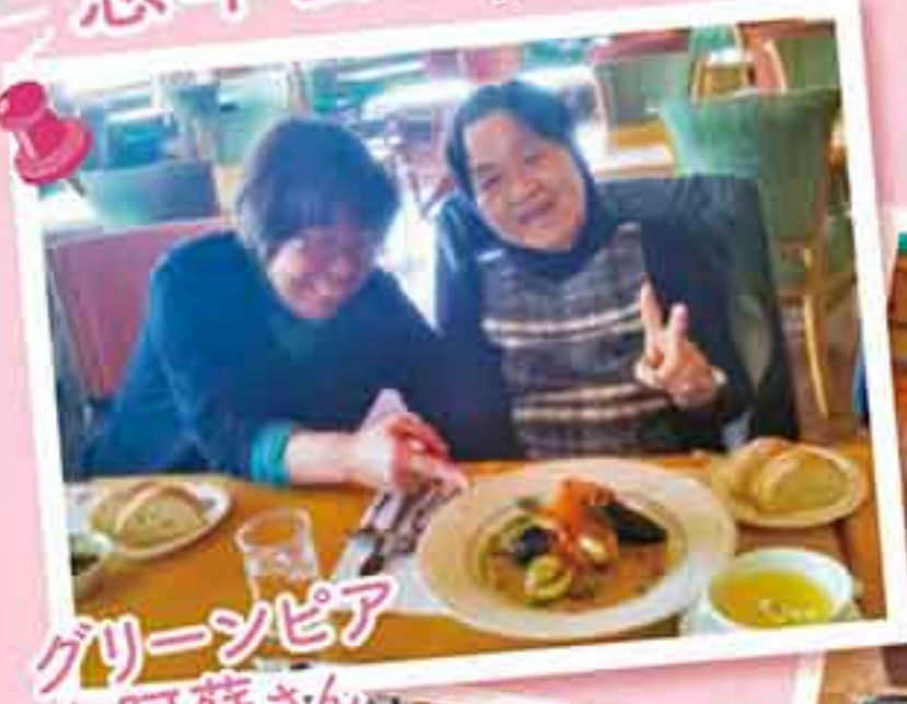
グリーンピア 南阿蘇さん