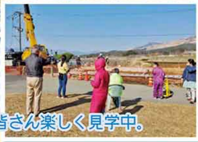
皆さん楽しく見学中。