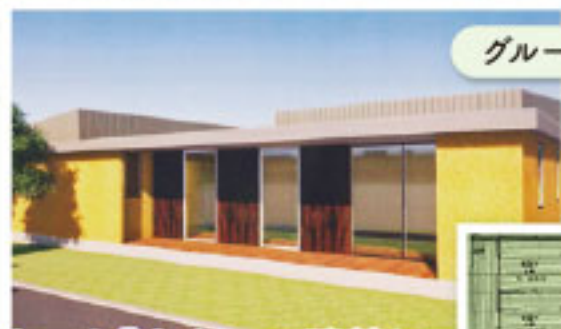
グループホーム「さくら」