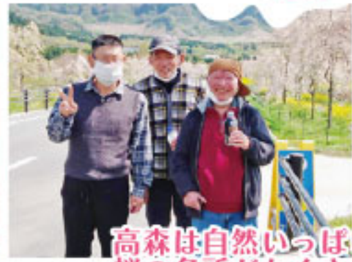
高森は自然いっぱい 桜の名所がたくさん!