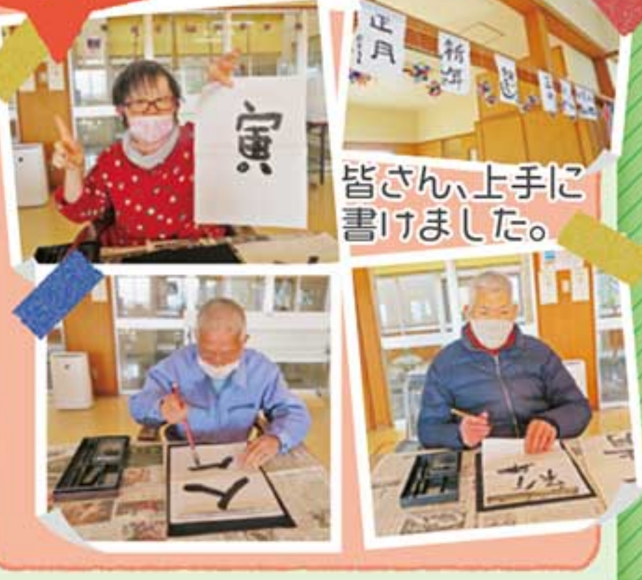
皆さん、上手に書けました。