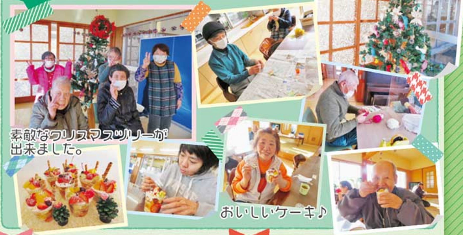
素敵なクリスマスツリーが出来ました。