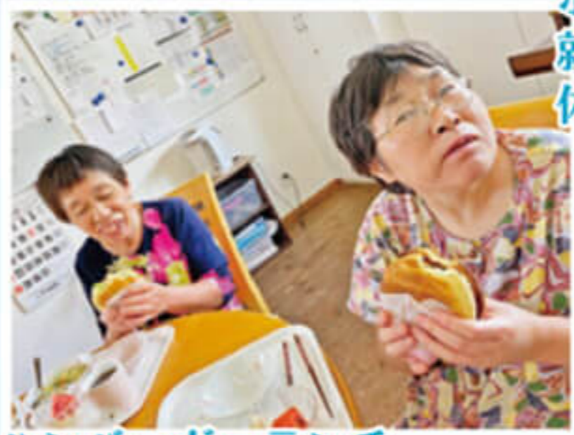
ハンバーガーランチ