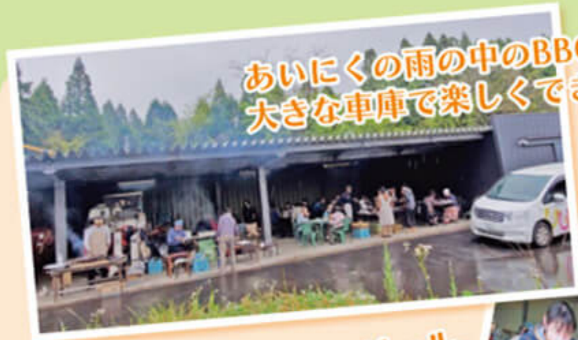
あいにくの雨の中のBBQとなりましたが 大きな車庫で楽しくできました。