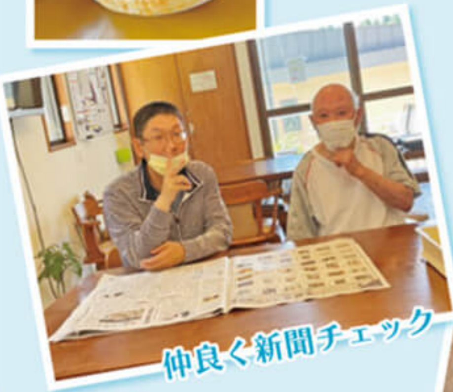
仲良く新聞チェック