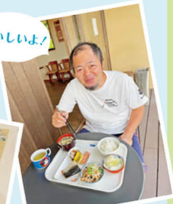
外での食事 ベランダ