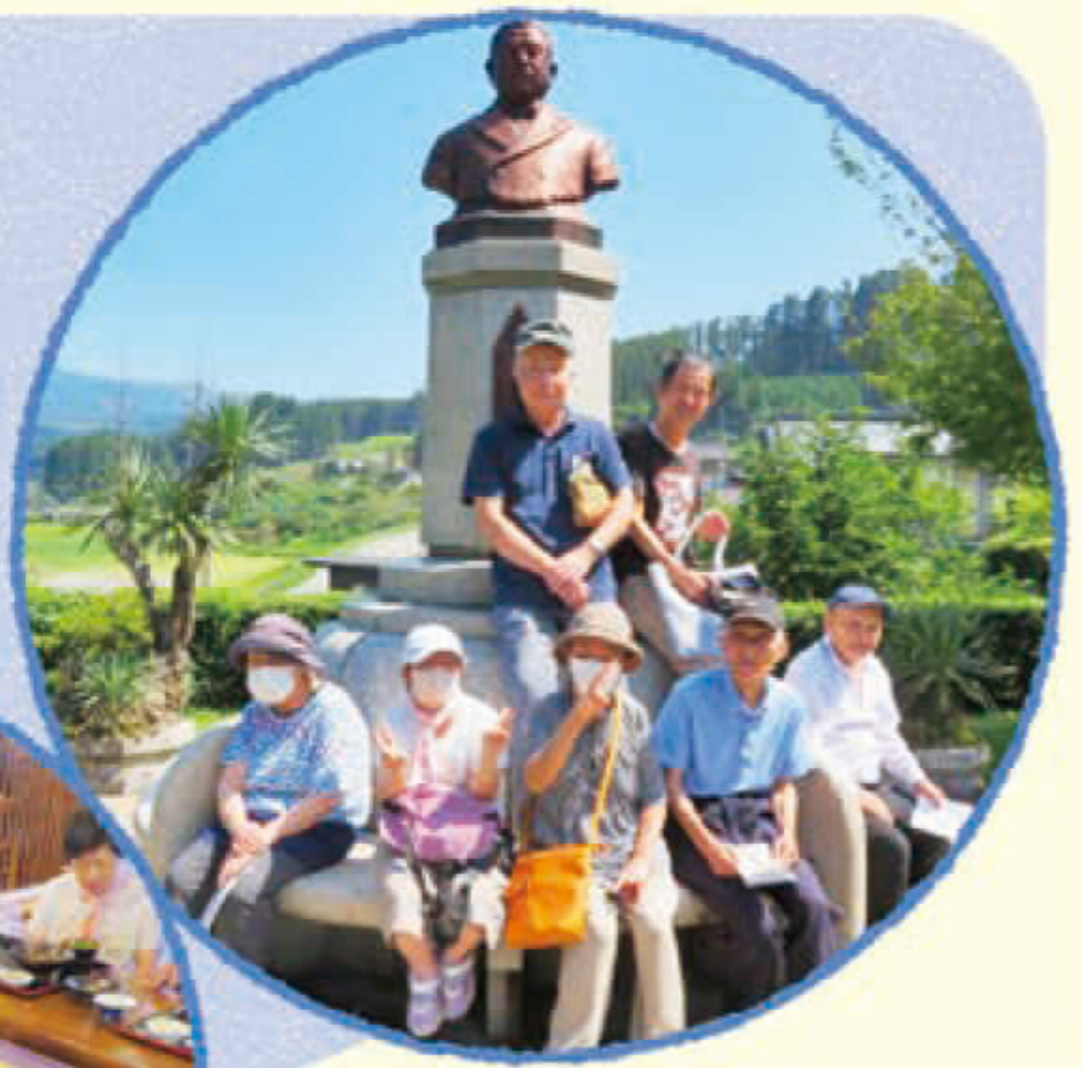
そばも食べました♪