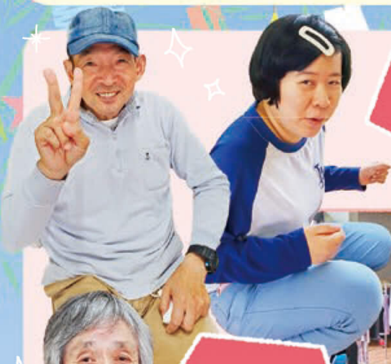
オシャレを 楽しむ!