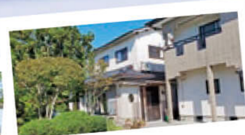
ホーム はなしのぶ