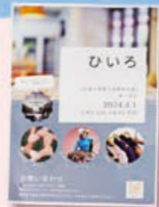
衣類・雑貨の 移動販売 「ひいろ」さん