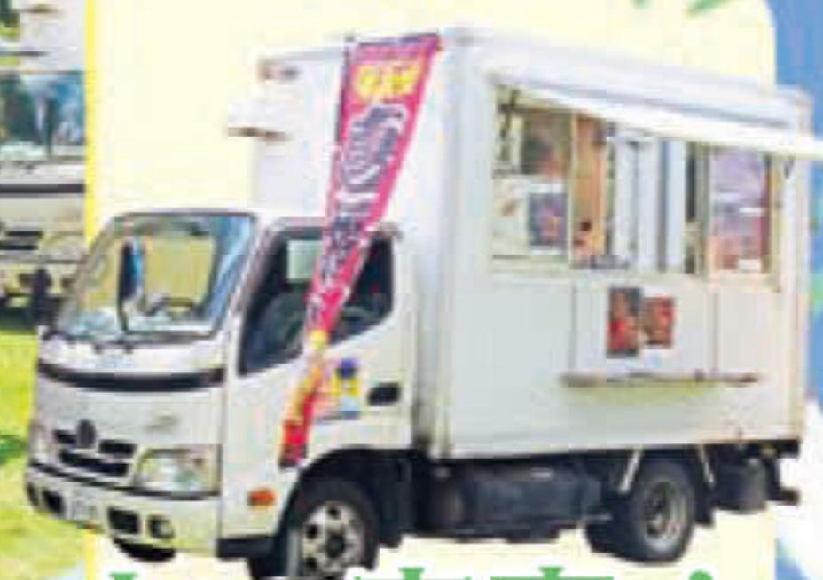
キッチンカー来寮!